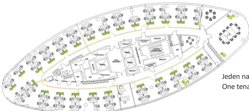
Jeden najemca One tenant